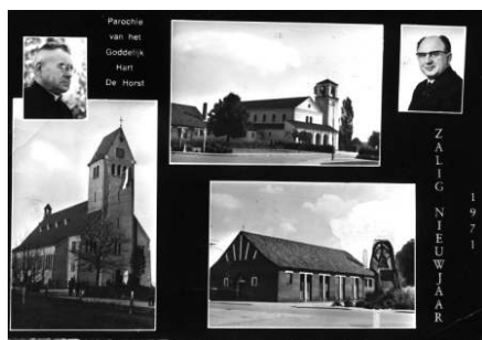
Nieuwjaarskaart van de Parochie van het Goddelijk Hart, De Horst. Op de foto staat links onder de kerk uit 1928, daarnaast de noodkerk van na WOII en daarboven de nieuwe kerk uit 1952.